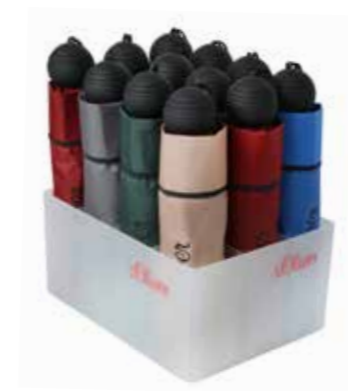
ART. NR. 78256SO L23,5/B17,5/H12 cm Bestückung: 12 Minischirme mit oder ohne Automatik