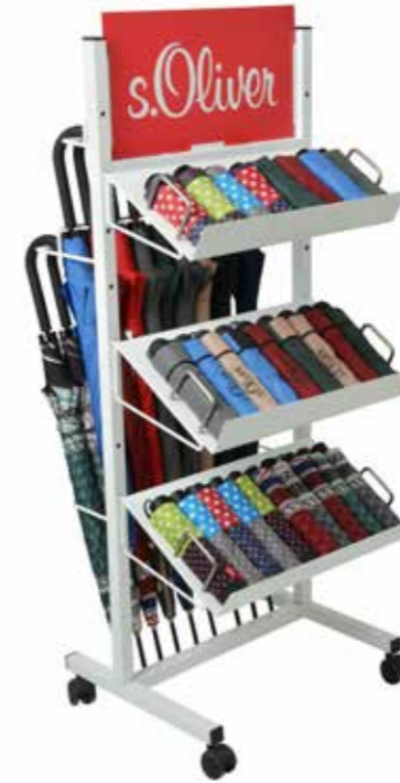
ART. NR. 861999SOK L53/B50/H135 cm Bestückung: 72 Minischirme mit oder ohne Automatik 24 Stockschirme