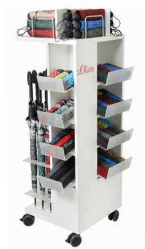
ART. NR. 862999SO L45/B45/H140 cm Bestückung: 96 Minischirme mit oder ohne Automatik 18 Stockschirme