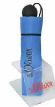
ART. NR. 86102SO Bestückung: 1 Minischirm mit oder ohne Automatik