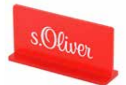
ART. NR. 78195SO Markenaufsteller aus Plexiglas